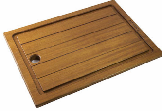
伊罗科木砧板 8643 117