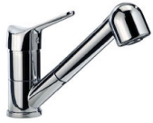
龙头 S1000 - Z65 8449 500