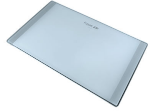
玻璃砧板 8633 300